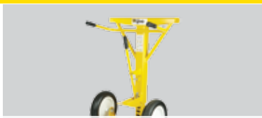
Supports pour remorques