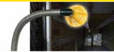
Éclairage pour quais