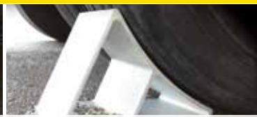
Systèmes de sécurité avec cales de roues