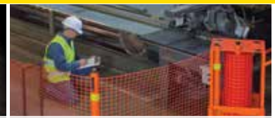
PSZ Barrière de Sécurité Portative